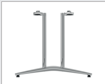
A 1702 T-Fuß Evo Rundrohrprofil zweisäulig / Ausleger 68 / 85 cm