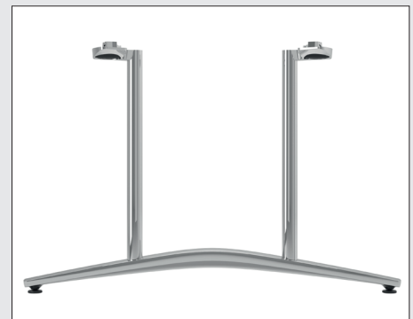
A 1702 T-Fuß Evo Rundrohrprofil zweisäulig / Ausleger 110 cm