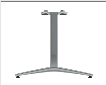
A 1701 T-Fuß Evo Ovalprofil einsäulig / Ausleger 68 / 85 cm

An elegantly curved cast aluminium foot stabiliser in three different sizes looks lightweight and replaces the former flat steel base of our new T-leg. One or two leg tubes mounted on the base provide the leg with a clear, beautifully designed appearance. The wealth of different T-leg versions combined with one of the numerous tabletops available for product family A 1700 guarantees a high degree of individualisation when choosing a personalized table system. Mounted at the centre of the tabletop, the T-leg version of A 1700 also assures plenty of legroom.